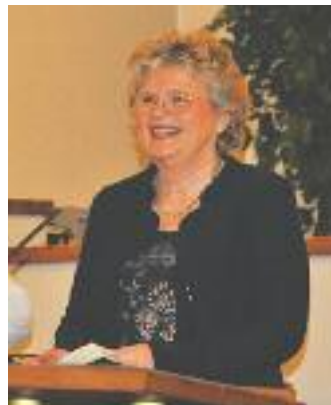
Venstre: Menighetens trofaste musikkrefter deltok med sang.