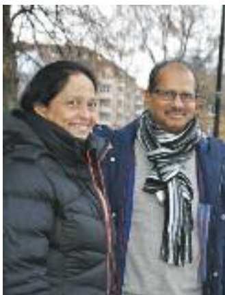
Over: Ekteparet fra Gjelleråsen er takknemlig for å få leve livet sammen med Jesus.